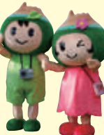
七飯町観光キャラクター ポロくん ポントちゃん

アクセス / JR「函館駅」から ●JR「大沼公園駅」まで特急「北斗」で 約30分、普通列車で約50分 ●函館バス「210系統」で 函館駅から大沼公園まで約70分 ●車で28km、約40分 (函館新道、国道5号線経由)